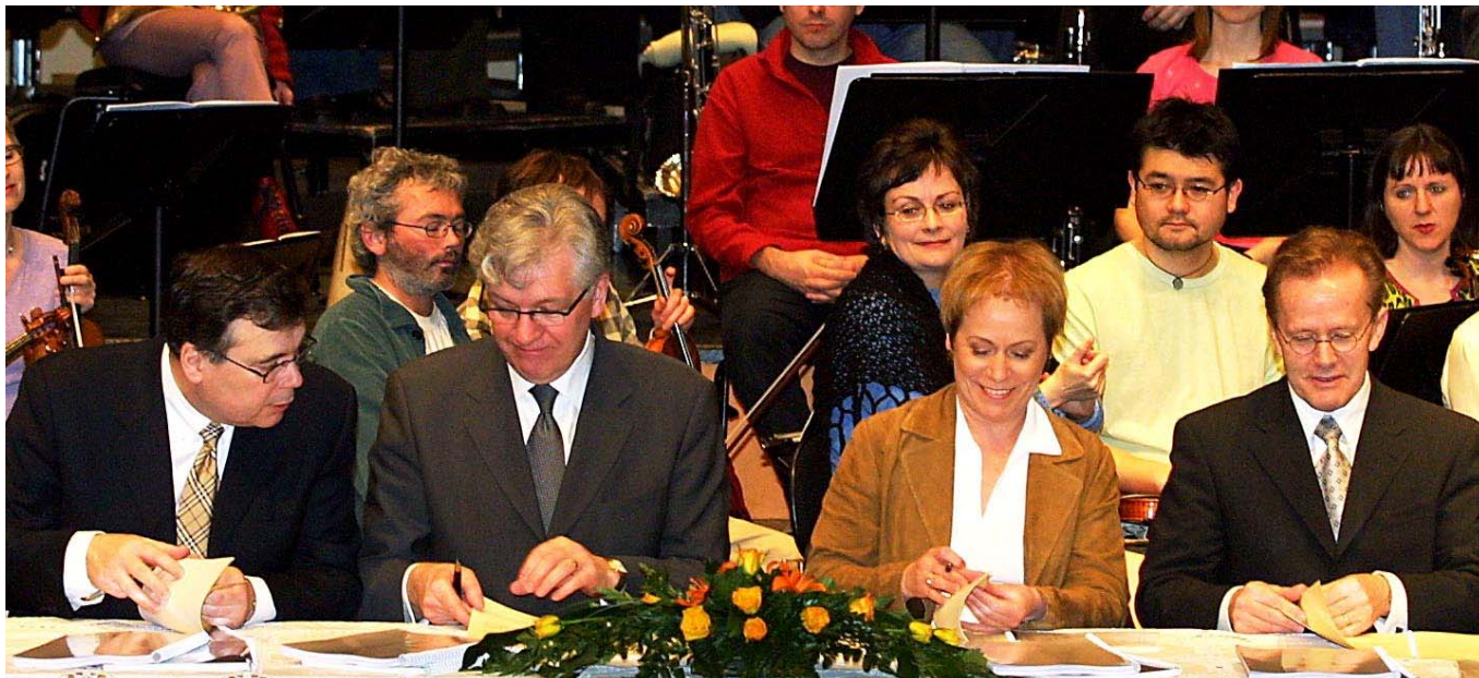
Geir Haarde fjármálaráðherra, Sturla Böðvarsson samgönguráðherra, Ingibjörg S. Gísladóttir borgarstjóri og Tómas Ingi Olrich undirrita samkomulagið. Hljómlistarmenn í Sinfóníuhljómsveit Íslands fylgjast með.

Ein stærsta stund í íslensku tónlistarlífi rann upp fimmtudaginn 11. apríl 2002 þegar Reykjavíkurborg og ríkisstjórn Íslands undirrituðu samkomulag um byggingu tónlistar- og ráðstefnuhúss við Austurhöfnina í miðborg Reykjavíkur.